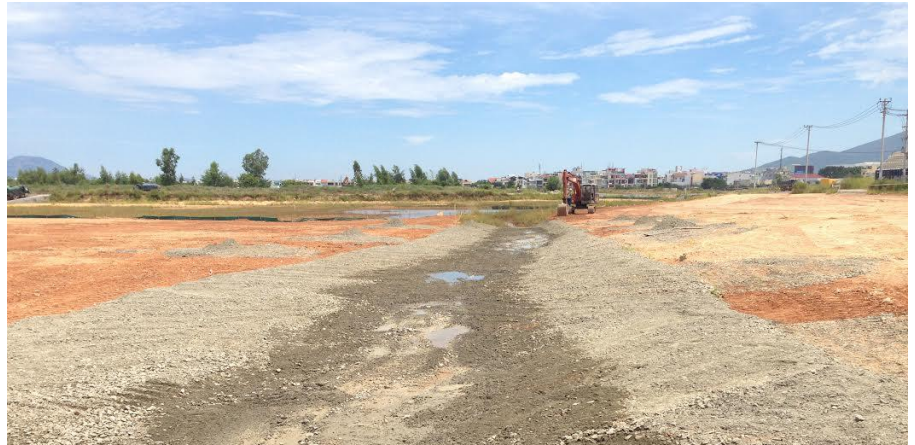
Chuẩn bị khu vực cho mùa mưa với các biện pháp chống xói mòn

Các nhà thầu USAID đã hoàn tất phần lớn hoạt động đào xới Giai đoạn 2 ở Hồ Sen và vùng đất ngập xung quanh ở đầu Bắc khu vực Dự án, nhanh hơn tiến độ dự kiến cho năm 2015. Các khu vực này được bảo vệ trước mùa mưa sắp tới bằng cách thực hiện các biện pháp kiểm soát xói mòn, rải sỏi nghiền sạch trên mặt khu vực bị nhiễm bẩn nhằm ngăn ngừa các chất nhiễm bẩn thoát ra khỏi khu vực.